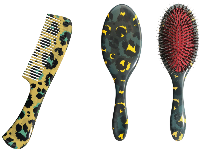
写真 左:DPC6 /右:D81M

・DPC6 プレジジョン ジャンボコム イエローレオパード:柔軟性のある柔らかな櫛通りが特徴です。使い勝手が良く、耐熱性、耐久性に優れています。標準小売価格 2,750円(税込)